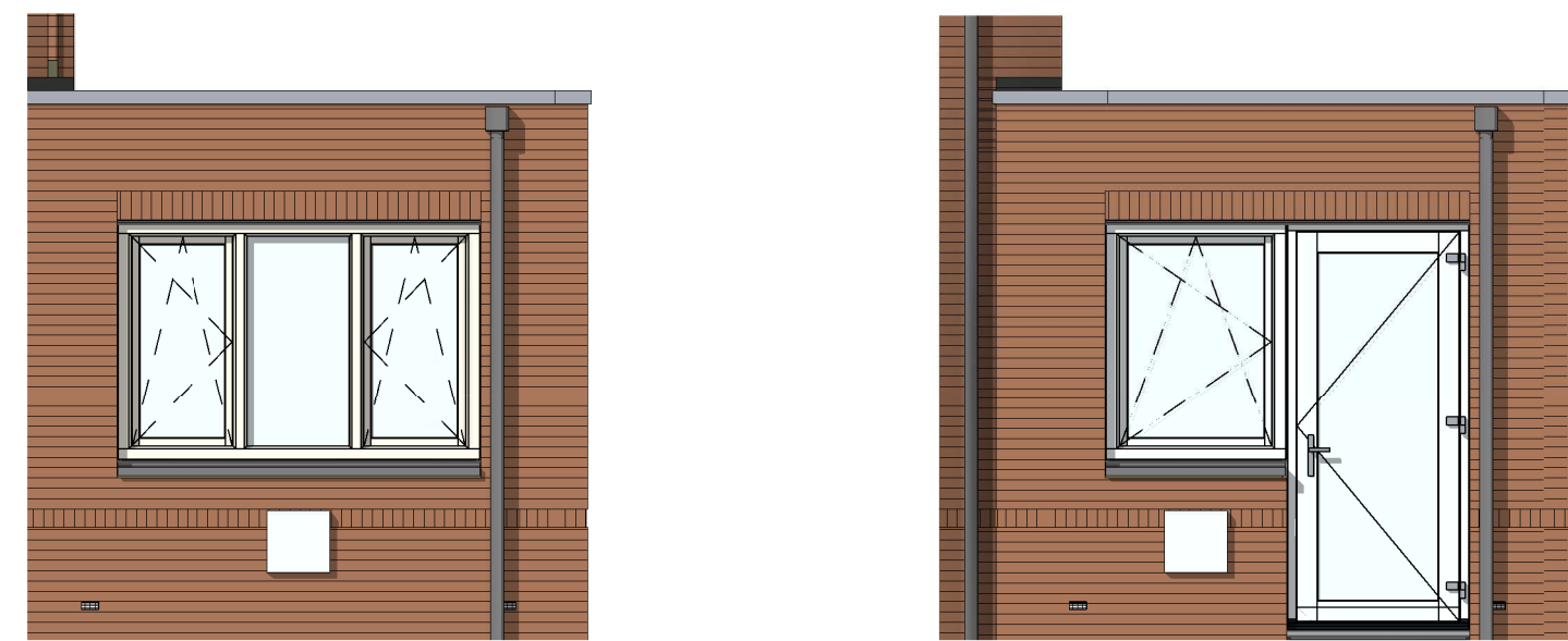
AG5024 - Kozijn met gemetselde borstwering in achtergevel aanbouw