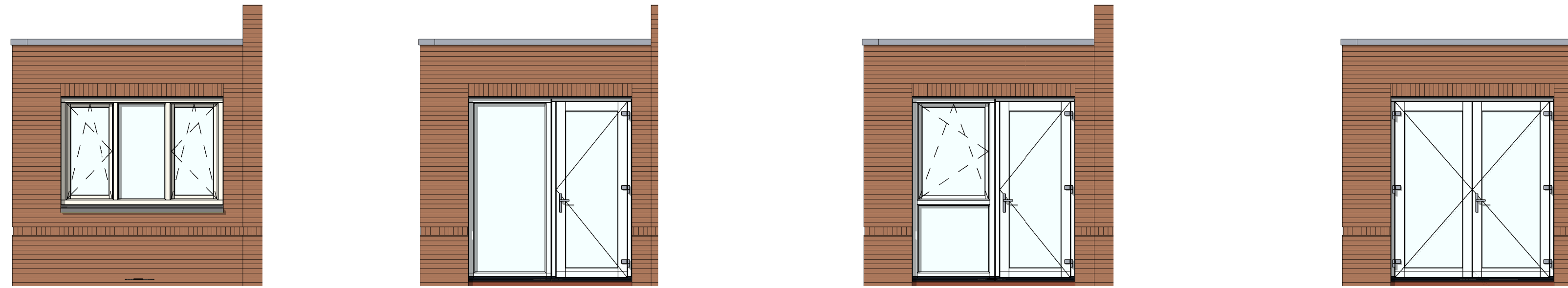
VG5029 - Dubbele deuren in voorgevel aanbouw