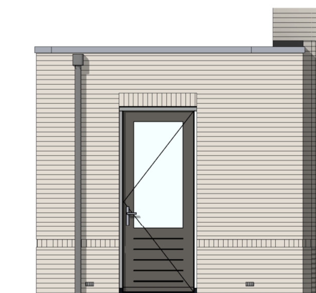
AG5021 - Enkele loopdeur in achtergevel gespouwd berging (basis)