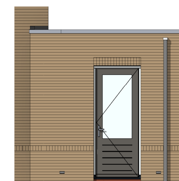
AG5021 - Enkele loopdeur in achtergevel gespouwde berging (basis)